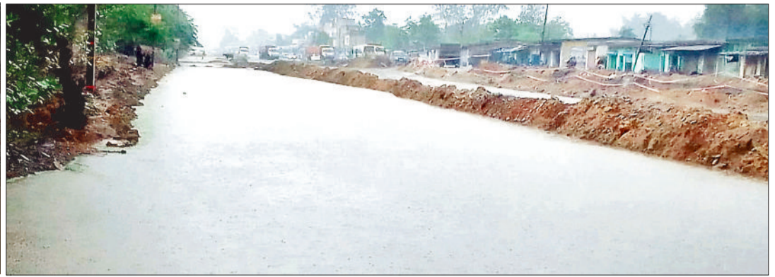
सर्वमंगला-कुसमुंडा फोरलेन मार्ग भरा पानी।