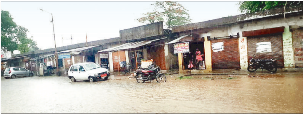
बालको अंबिका मंदिर रोड में भरा बारिश का पानी।