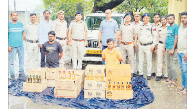
पुलिस गिरफ्तार में आरोपी एवं जब्त अंग्रेजी शराब।

आबकारी विभाग की टीम ने बिलासपुर-अंबिकापुर हाईवे पर चकचकवा पहाड़ के समीप