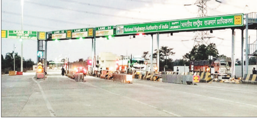
रजकम्मा मदनपुर स्थित टोल प्लाजा।

जिले के रजकम्मा मदनपुर एनएच 130 के टोल प्लाजा में कर वसूली के नियमों पर स्थानीय लोगों ने आपत्ति जताते हुए टोल प्लाजा को उस स्थान से हटाने की मांग पर अड़े हैं। उनका कहना है कि नियम विरुद्ध तरीके से उनसे टैक्स लिया जा रहा है। बार-बार शिकायतों के बावजूद निराकरण नहीं करने से आक्रोशित ग्रामीणों ने 1 जुलाई से अनिश्चित कालीन धरना प्रदर्शन करने की चेतावनी दी है।